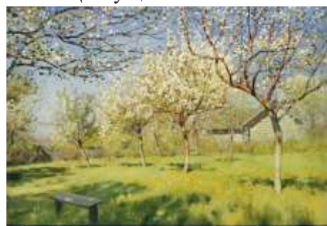
И.Остроухов «Ранняя весна»