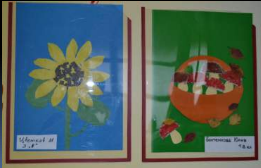
Ученик М 3.8